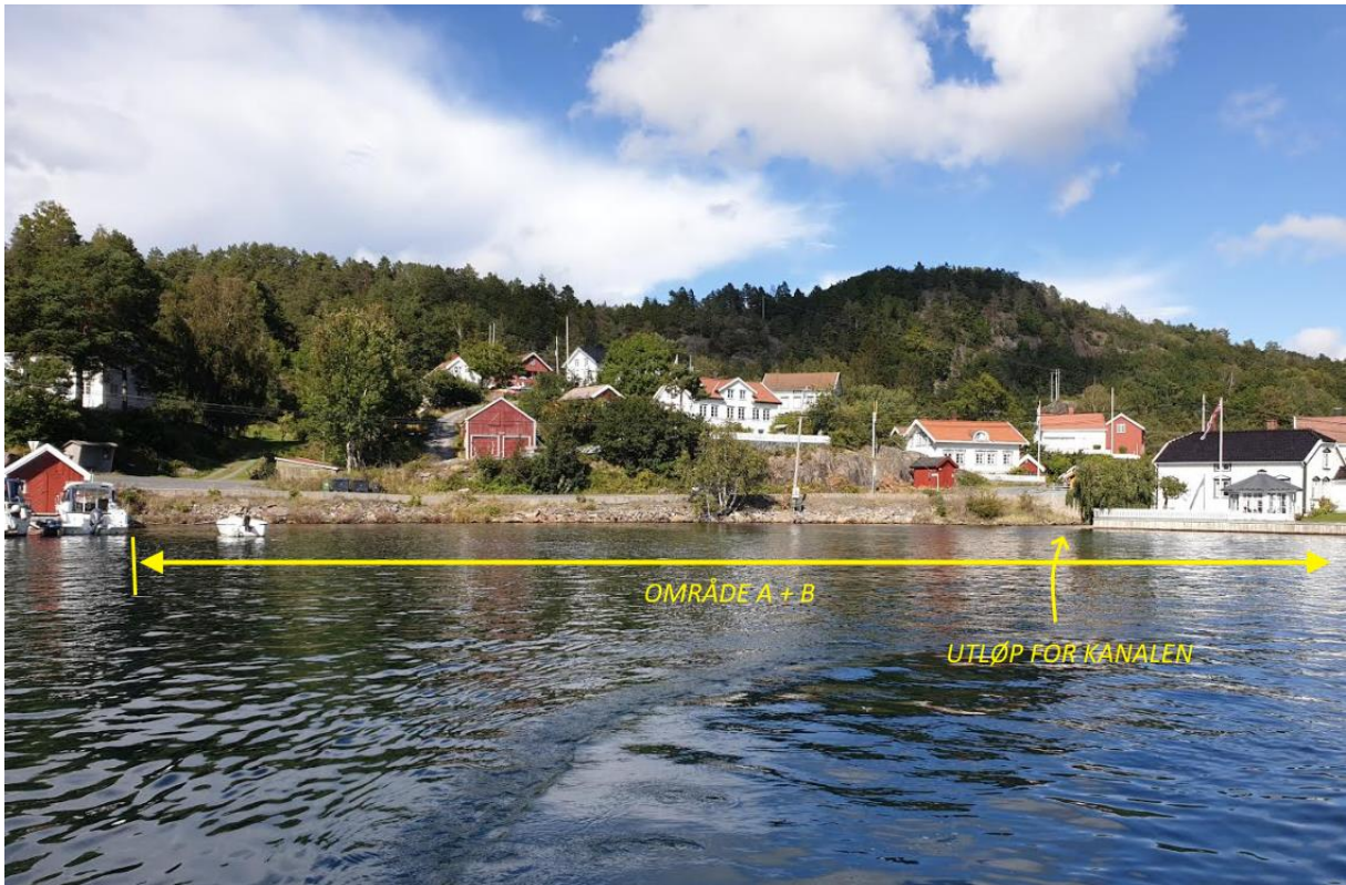
Bilde 2: Deler av det aktuelle området sett fra fylkesveien: