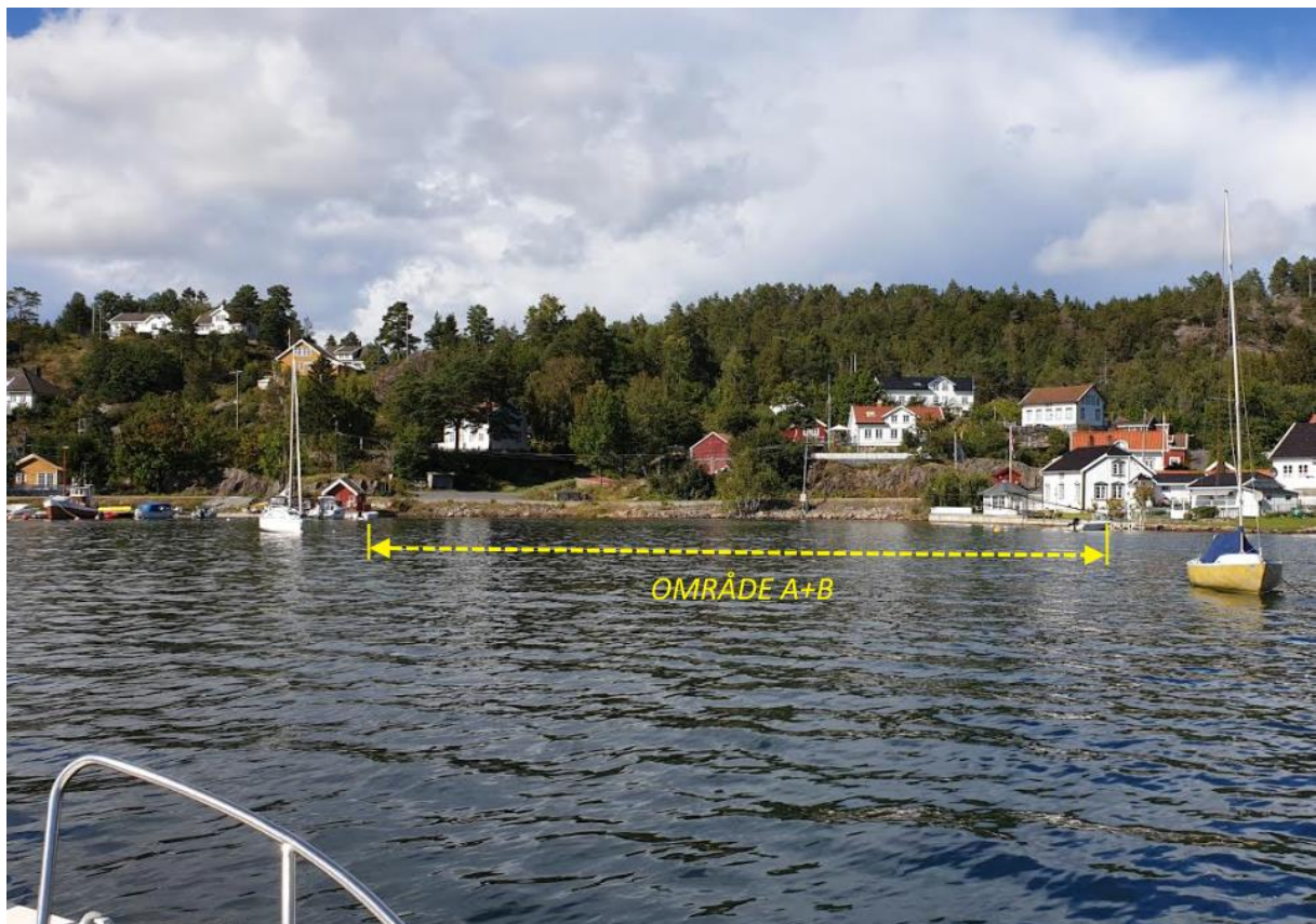
Bilde 2: Det aktuelle området (nærmere):