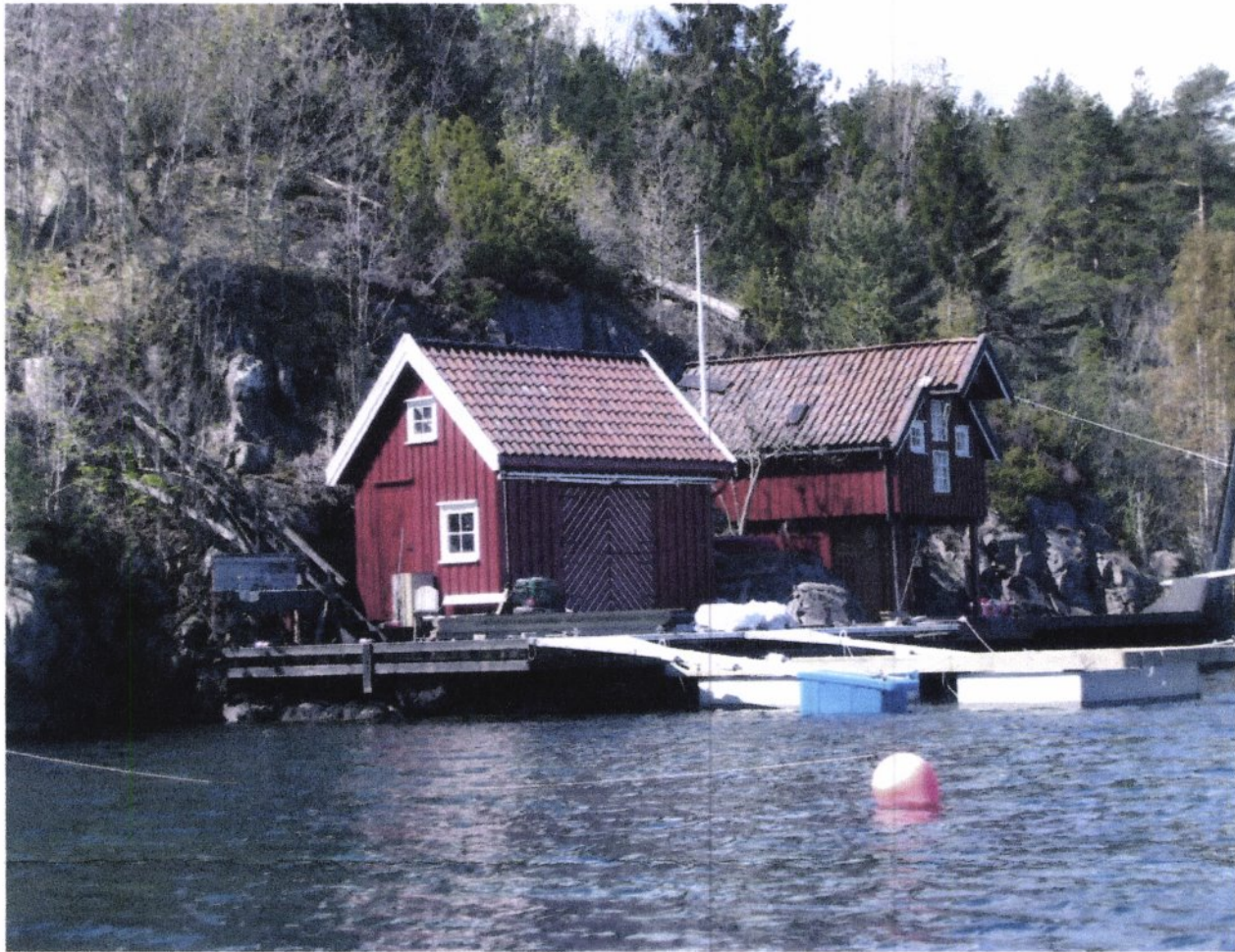
Båthus og bryggeanlegg.

Eiendom: Gårdsnr. 80 Bruksnr. 185 (se forøvrig første side) KOMMUNE TVEDESTRAND Adresse: Askerøya, 4910 LYGØR