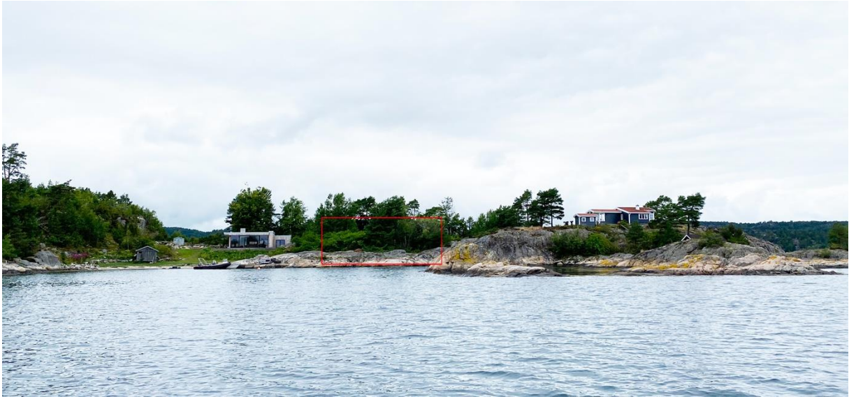
* Rød: Merket tomtområde (tiltenkt hytte ikke tegnet inn)