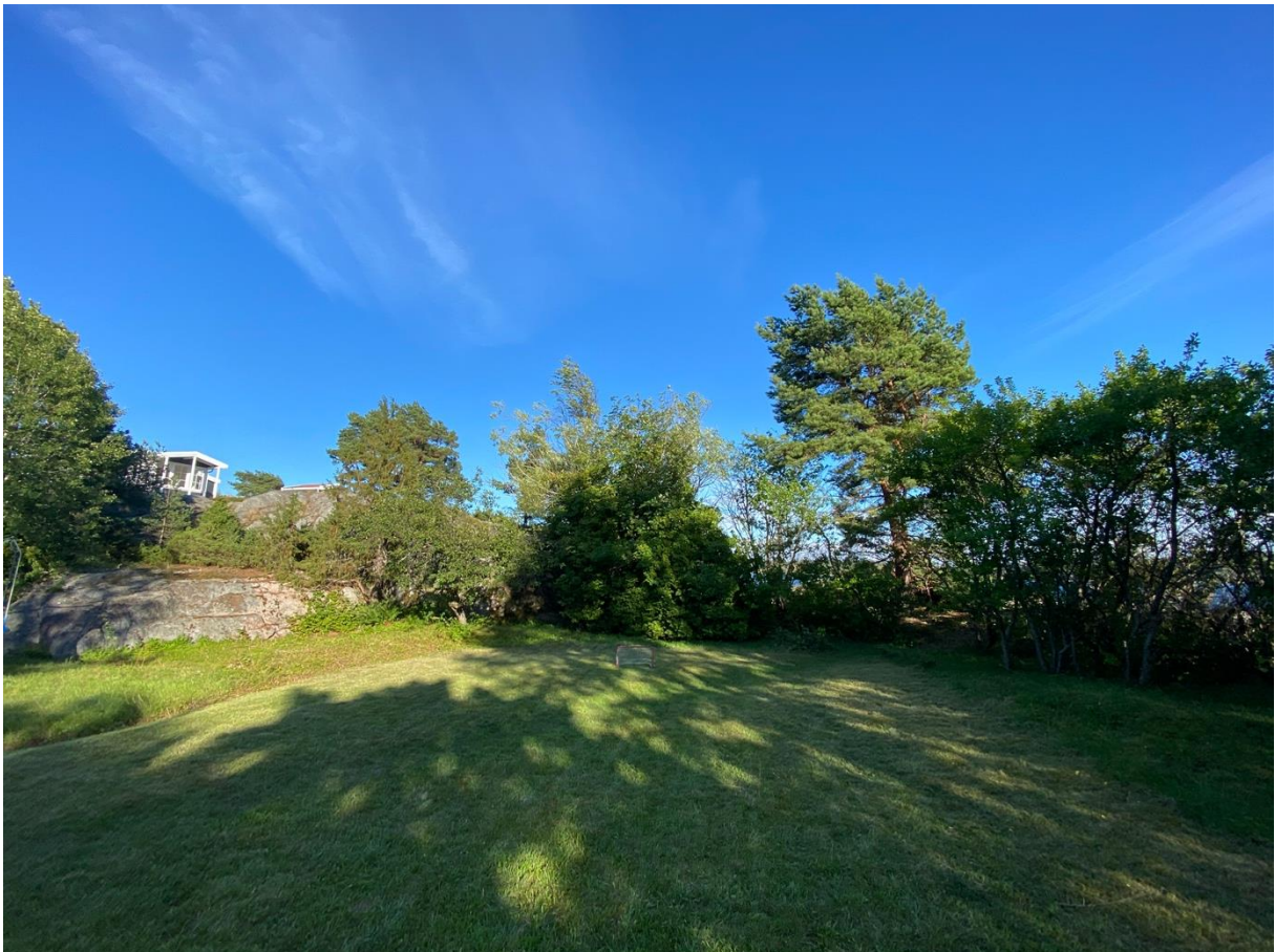
* Tomt sett fra bakkant (jordet)