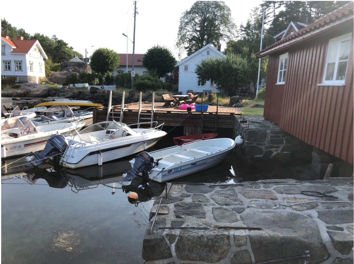
Figur 2 , viser sjøsiden av naustet med gammel steinbrygge.