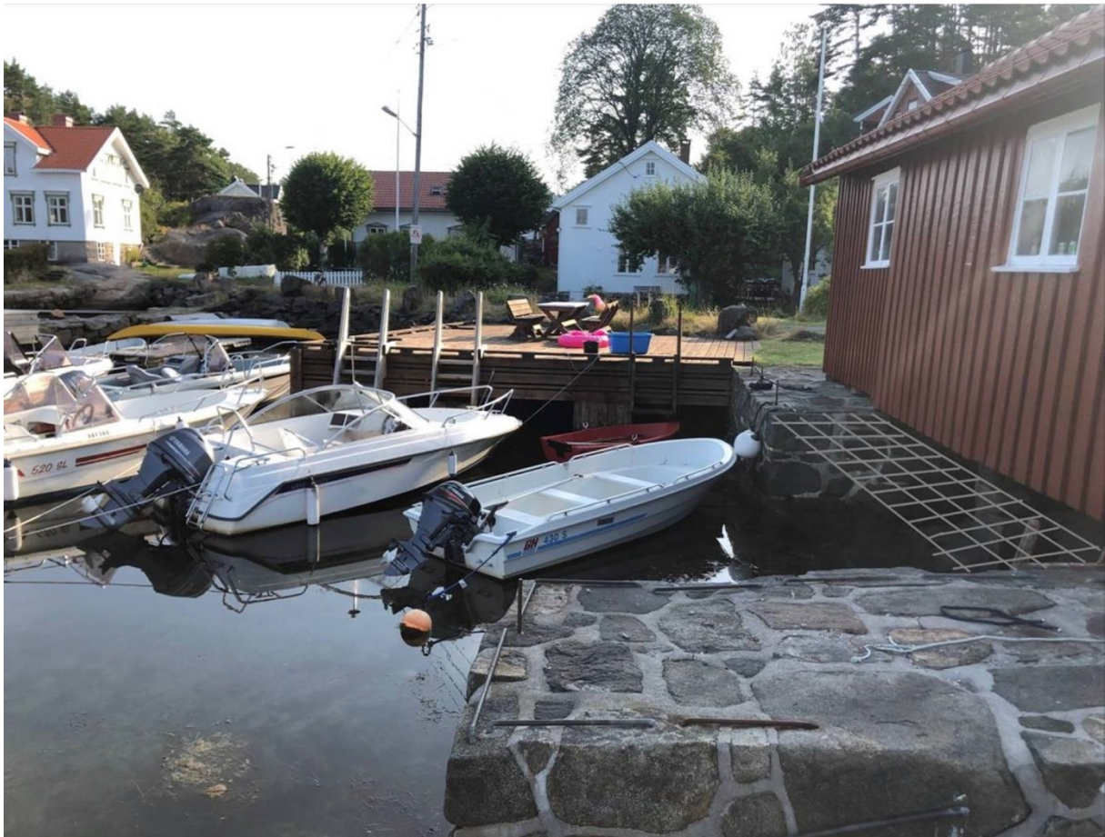
Figur 3 , de grå strekene viser hvordan vi ser for oss at de gamle steinbryggen kan forbindes i forkant av naustet..