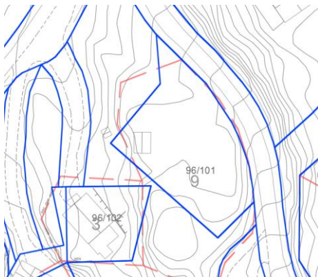
Fig. 3. Blå linjer viser grenser fra gjeldene reguleringsplan, røde linjer viser eiendomsgrenser.

Samlet sett foreslås det å endre ett areal på ca 620 m 2 fra friluftsområde til fritidsbebyggelse. Friluftsområdene som foreslås endret til fritidsbebyggelse ligger tett opptil fritidsbebyggelsen og er av mindre verdi for allmennheten. Vi kan ikke se at endringen får konsekvenser for friluftslivet i området, da vedtatt plan består av store arealer med friluftsområde.