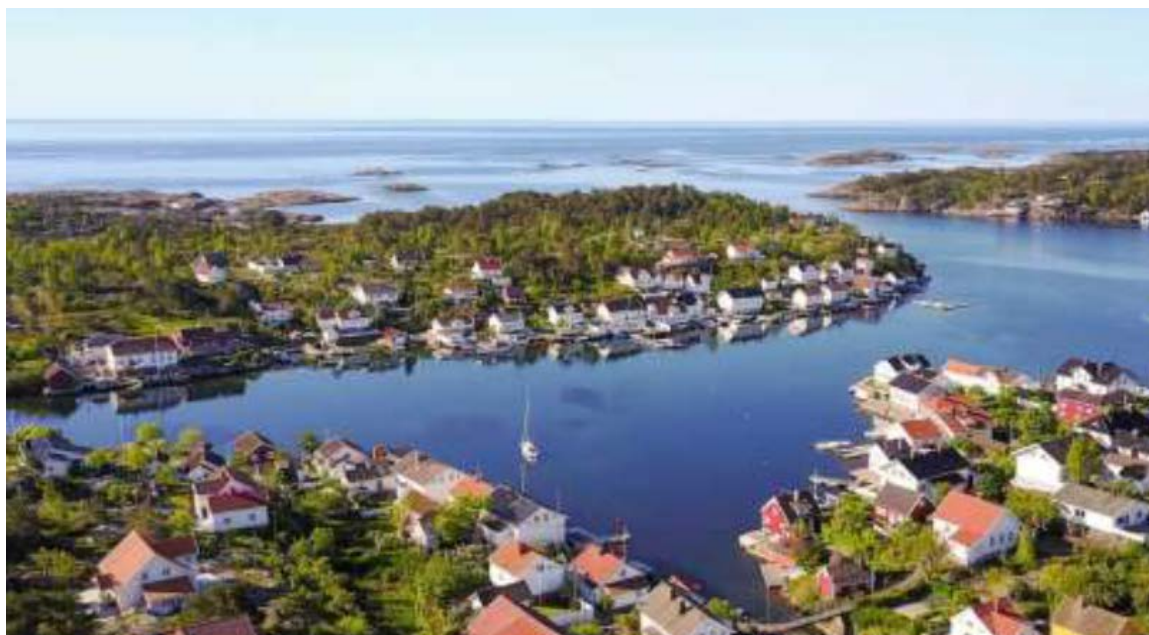
Foto 1 Lyngør på en solskinnsdag.

Det er nå høstet mye erfaring med forvaltning av byggesaker i medhold av planen. I all hovedsak er målsettingene oppnådd om færre dispensasjoner og mindre konflikt mot statlig nivå, samt enklere og billigere saksbehandling for mindre byggetiltak uten at det har gått på bekostning av hensynet bak den strenge arealpolitikken langs kysten.