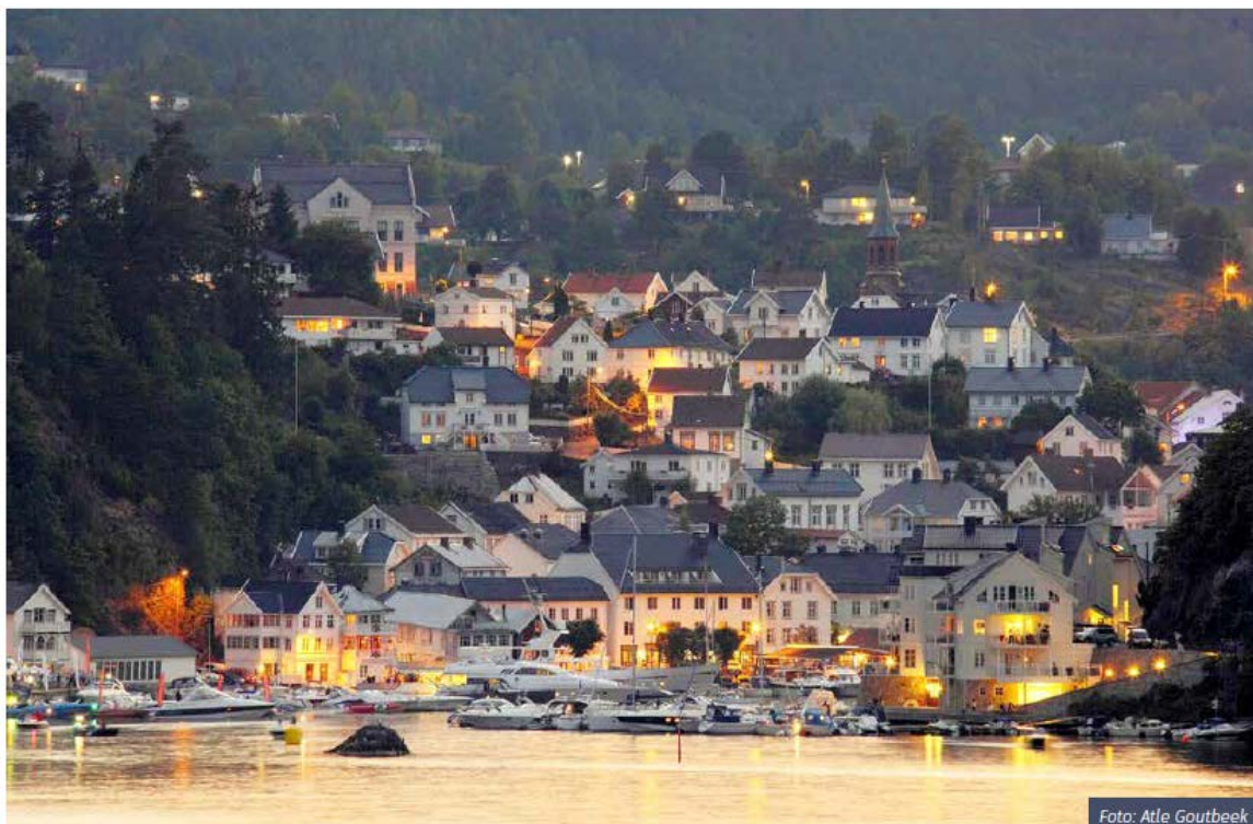
Foto 2 Tvedestrand historiske sentrum sett fra fjorden

Det er gjennomført store investeringer i Tvedestrand, og flere står for tur om kort tid. Det er behov for å se på arealkonsekvensene av disse tiltakene i et overordnet perspektiv, særlig gjelder dette arealer til boligutvikling med gang og sykkelavstand til skoler, idrettsanlegg og med god tilgang på nærfriluftsområder mm. Ved revisjonen må det legges vekt på å finne boligområder som gir god bokvalitet, samtidig som det økonomiseres med de store grunnlagsinvesteringene som er gjennomført. eksempelvis vil arealene på begge sider av ny Fylkesvei mellom Vasstø og Grenstøl, samt arealene nær nye Mjåvann VGS vurderes. Det må også gis politiske føringer for krav til differensierte boligtyper ved fordeling mellom eneboliger og leilighetsbygg, samt hvilke utnyttelsesgrad det skal legges opp til.