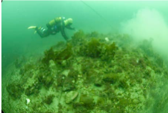
Ballastrøysen ved Sagesund